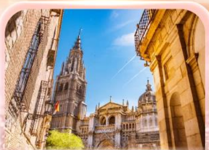
มหาวิหารแห่งโทเลโด