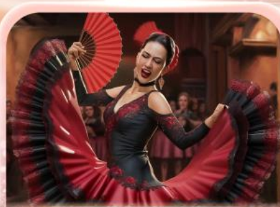
ระบำฟลามิงโก