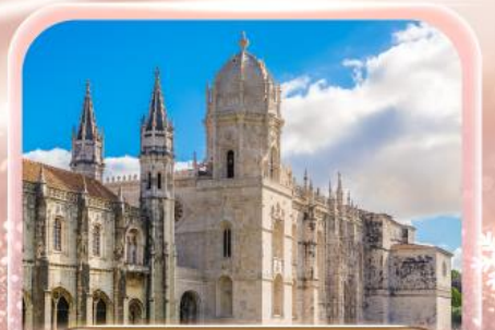
มหาวิหารจอร์นโบ