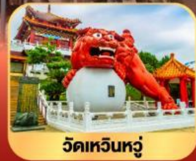
วัดเหวินหนู่