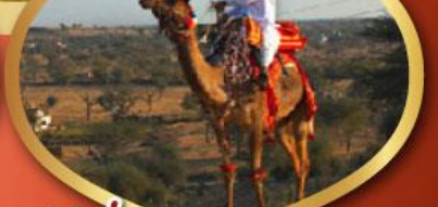
ฟรี ژیوซู เมืองมันทอวา ราคาเริ่มต้น