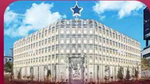
ย่านซองซู