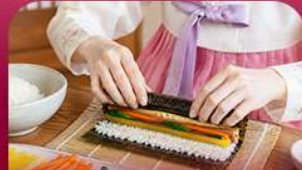
เรียงทำคิมบับ

สัมผัสเสน่ห์ฤดูหนาวของเกาหลีแบบอบอุ่นหัวใจพิเศษ! พักสกีรีสอร์ท 1 คืน ท่ามกลางบรรยากาศหิมะขาวโพลน สนุกกับกิจกรรมฤดูหนาวยอดนิยม ทั้งสกี สโนว์บอร์ดและสโนว์สเลด ก่อนออกเดินทางสู่เกาะนามิ ดินแดนแห่งความโรแมนติก ชิมสตรอว์เบอร์รี่หวานฉ่ำ สด ๆ จากฟาร์ม พร้อมเรียนทำคิมบับเมนูยอดฮิตสไตล์เกาหลี ปิดท้ายด้วยการช้อปปิ้งสุดฟินที่เมืองคยองและซองซู ย่านอิคทีสายคาเฟ่และสายแฟชั่นห้ามพลาด