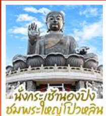
นั่งกระเช้ามองปิง ชมพระใหญ่ไป่หวลัน

นั่งกระเช้ามองปิงสีกการะพระใหญ่ไป่หวลัน • วัดหวังต้าเซียน ขอพรสุขภาพ ความรัก วัดเขกงหนิว ขอพรองค์เขกง โชคลาภ การเงินและธุรกิจ • เจ้าแม่กวนอิมรพีลาลัย รับพลังงานดี เสริมพลังฮวงจุ้ย • วัดหมิ่นโหมว ขอพรเรื่องการศึกษ การงาน สติปัญญาและความกล้าหาญ