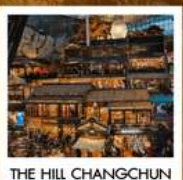
THE HILL CHANGCHUN