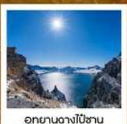
อุทยานดางโป้ซาน