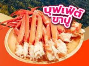
บุฟเฟ่ต์ ซาซึ

รวมจุดเช็คอินชมใบไม้เปลี่ยนสี โอซาก้า ชิซุโอะกะ ฟูจิ โตเกียว