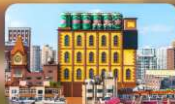
โรงงานเบียร์ซิงเต๋า