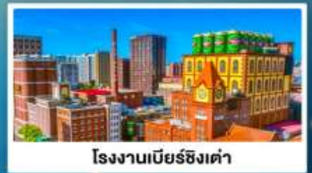
โรงงานเบียร์ซิงเต่า