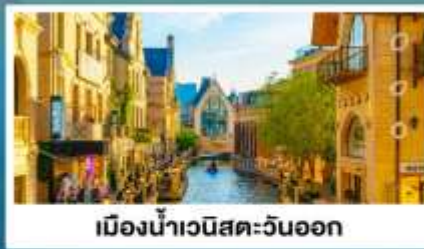
เมืองน้ำเวนิสตะวันออก