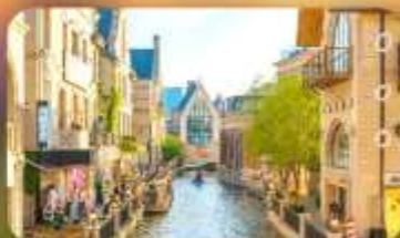
เมืองน้ำเวนิสตะวันออก