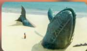
ประติมากรรมวาฬโดดเคี้ยว