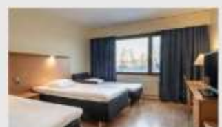
Triple สำหรับ 3 ท่าน