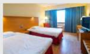
Twin สำหรับ 2 ท่าน