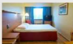
Double สำหรับ 2 ท่าน