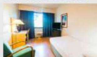
Single สำหรับ 1 ท่าน