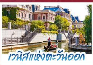
เวนิสแห่งตะวันออก