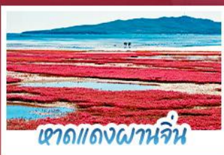
หาดแดงผานจีน