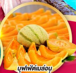
บุฟเฟ่ต์เมล่อน หอม หวาน ฉ่ำ