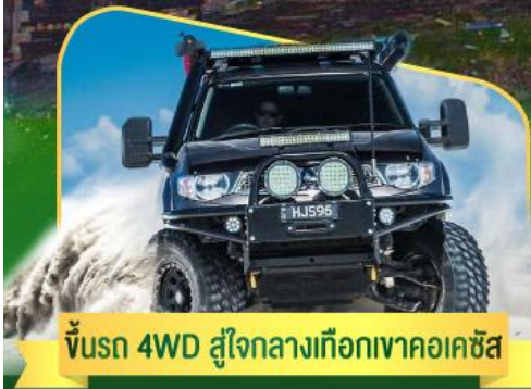
คันรถ 4WD สู้อีกกลางเทือกเขาคอเคซัส