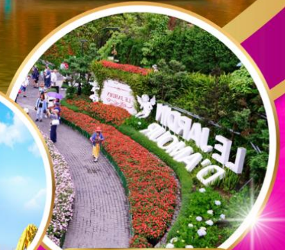
Le Jardin d'Amour