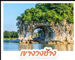
เขาวงวงช้าง