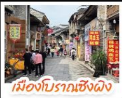
เมืองโบราณเซียงผิง

เช็คอินจุดไฮไลท์กุ้ยหลิน เจดีย์เงินเจดีย์ทอง รางวงช้าง นั่งเคเบิลคาร์สู่ เทาหลู้อี จุดชมวิวกะลาภูเขา ๓ แห่งเมืองหยางซั่ว ล่องเรือแม่น้ำลู่เจียง ตามรอยช้างหลังภาพรมบัตร 20 หยวน อิสระช้อปปิ้งถนนคนเดิน 2 แห่ง ถนนดงซีเซียง ถนนซีเจียง นั่งกระเช้าบอลลูนชมวิวแบบ 360 องศา