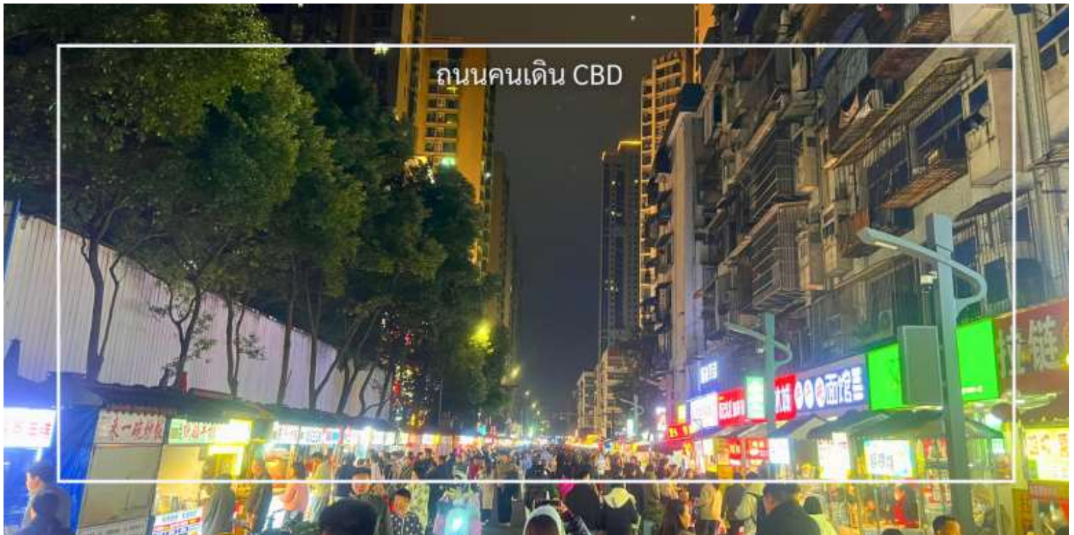
คนรุ่นใหม่

จากนั้นนำท่านเดินทางกลับเมือง อี้ชาง (Yichang) (ใช้เวลาประมาณ 3.30 ชั่วโมง) เดินทางสู่ ถนนคนเดิน CBD ย่านการค้าและสตรีทฟู้ดใจกลางเมืองอี้ชาง แหล่งรวมอาหารท้องถิ่น เสื้อผ้าแฟชั่น และห้างสรรพสินค้ามากมาย เหมาะสำหรับเดินช้อปปิ้งและสัมผัสวิถีชีวิตคนเมือง นวมถึงร้านของสะสมยอดนิยมที่ได้รับความนิยมอย่างมากในกลุ่ม