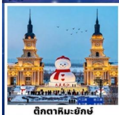
ตึกตาคิมะฮักซ์