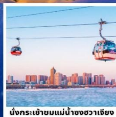
นั่งกระเช้าชมแม่น้ำขงฮวาเจียง