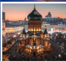
โบสถ์โซเฟีย