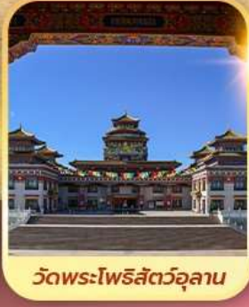
วัดพระโพธิสัตว์อุลาน