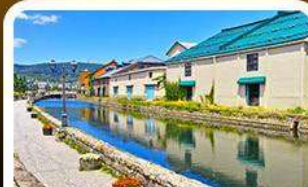
คลองไอตารุ