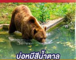
บ่อหมีสีน้ำตาล