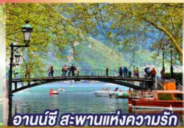
อานนชี สะพานแห่งความรัก