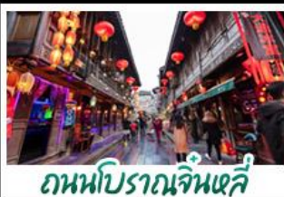
ถนนโบราณจั้นหลี่