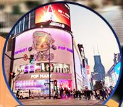
ถนนหนานจิง