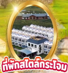
ที่พักสไตล์กริมโรว