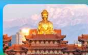
วัดพระใหญ่หวงกงซาน