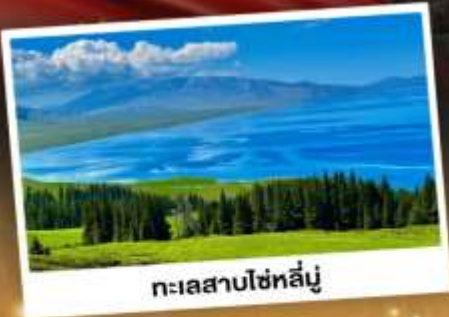
ทะเลสาบไซทาลี