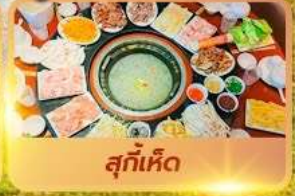
สุกี้เด็ด