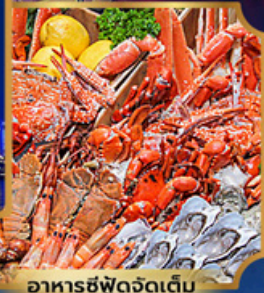
อาหารซีฟู้ดจัดเต็ม

บุฟเฟ่ต์เบียร์ไม่อั้น + ซีฟู้ด + บิงย่างเกาหลี