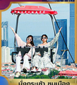
นั่งกระเช้า ชมเมือง