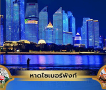
หาดโซเบอร์ฟังก์