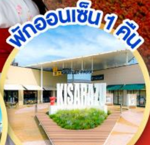
มิตซึย เอ้าท์เล็ต พาร์ค คิชะระชู