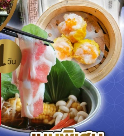
เจ้าแม่กวนอิม ริพลัสเบย์