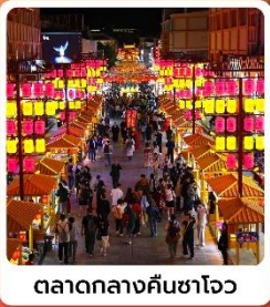
ตลาดกลางคืนซาโจว