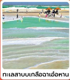
ทะเลสาบเกลือจาเอ้อหาน