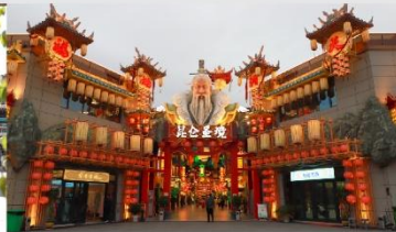
เมืองจำลองวัฒนธรรมคุนหลุน