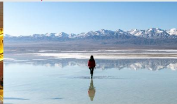
ทะเลสาบซิงไห่

*ทางบริษัทฯ ขอสงวนสิทธิ์ในการสลับโปรแกรมทัวร์ตามความเหมาะสมขึ้นอยู่กับสถานการณ์หน้างาน โดยคำนึงถึงผลประโยชน์ของลูกค้าเป็นสำคัญ