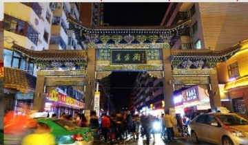
ตลาดกลางคืนถนนม่อเจีย