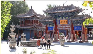
วัดพระใหญ่จางเย่