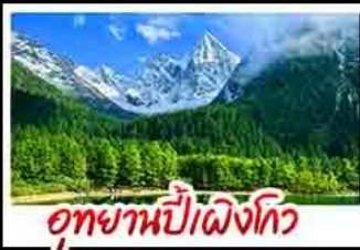
อุทยานป่าเผิงโกว

อุทยานสัตว์ดุณี - อุทยานป่าเผิงโกว - เมืองตุเจียงชงัน - รูปปั้นเขมัมแพนถ่านอนเชคพี ร้านหนังสือจุงชู่เกอ - ล่องเรือชมเขาวงฟ้อโตเล่อซาน - ถ่านบิราถนชอชกวางชอยแคบ - วัดต้าซือ ถ่านคนดินชุนชี่ลู่ - เขมัมแพนถ่านปิ่นตีกาฟัส - ถ่านทู่กู่เสี - ชมแม่สรงสีหน้าพู่ไม้อีฟตีก SKP - ชมตีกาฟอถิงตุ