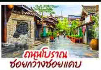
ถ่านบิราถนชอชกวางชอยแคบ