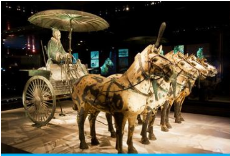
สุสานกองทัพทหารม้าจีน