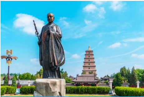
เจดีย์ห้าชั้นปาใหญ่