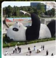
รูปปั้นหมีแพนด้าเซลฟ์

แวะชิมปิ้งย่างหมาล่า ร้านคุณพ่อ (แท้จริง) ที่เมืองเล่อชาน เดินทาง