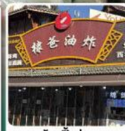
ร้านปิ้งย่าง ของพ่อหวังเหอตี้