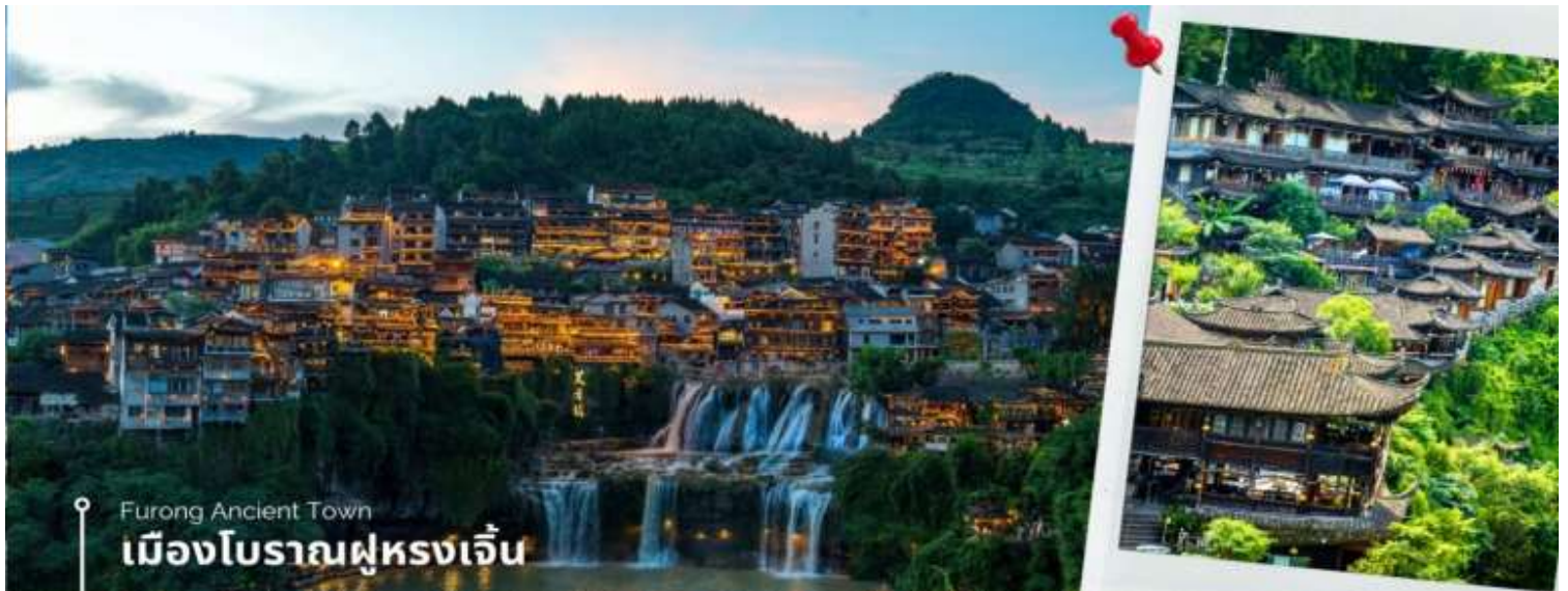
Furong Ancient Town เมืองโบราณฟูหลงเจิ้น

ท่านสามารถ ชมโชว์วัฒนธรรมฟูหลงโบราณ (หากสภาพอากาศไม่อำนวย จะงดการแสดง) จากนั้นนำท่าน ชมความงาม น้ำตกฟูหลง ซึ่งเป็นเอกลักษณ์ของเมืองฟูหลง เป็นน้ำตกที่อยู่ใจกลางเมือง ถ้ามองจากฝั่งตรงข้ามจะดูเหมือนว่าเมืองตั้งอยู่บน หน้าผาที่มีน้ำตกไหลอยู่ข้างล่าง น้ำตกนี้มีขนาดกว้างประมาณ 40 เมตร และสูงประมาณ 60 เมตร ซึ่งความพิเศษอีกอย่าง ของที่นี่คือ เราสามารถเดินผ่านด้านหลังม่านน้ำตกได้