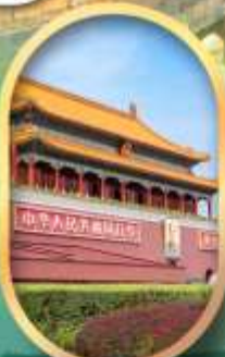
จัสมุฏฐาเทียนอันเหมิน