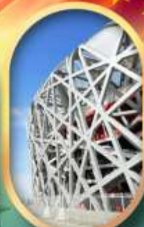
ผ่านชมสนามกีฬาาริงนก