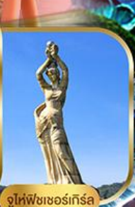
จูไห่ฟิชชอร์ทรีซ่า