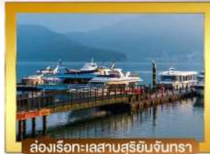
ล่องเรือทะเลสาบสุริยอินจันตรา