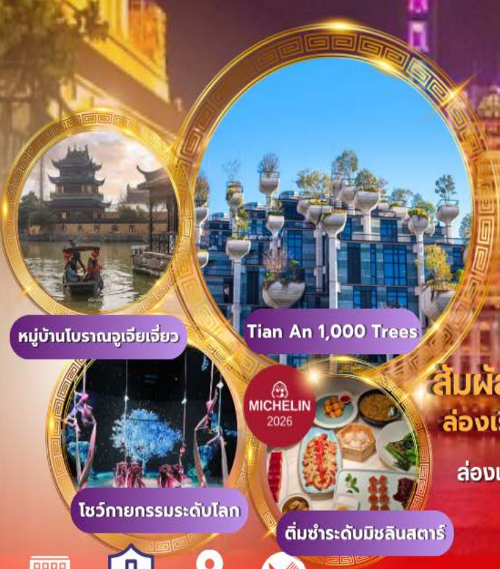
หมู่บ้านโบราณจูเจียเจียว

บินหรู Full service พัก 5 ดาวย่านช้อปปิ้ง