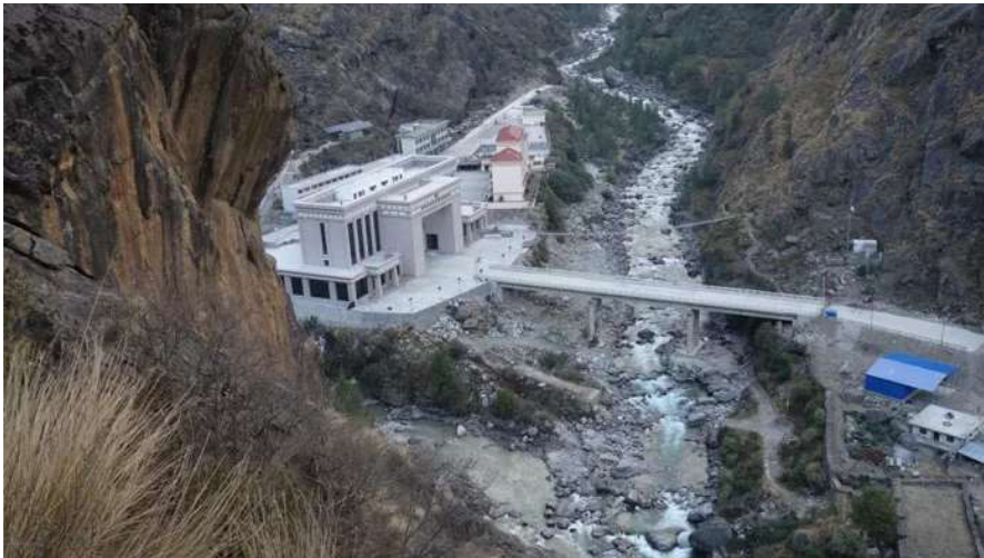
ถึง ด่านพรมแดน พาท่านเดินทางตรวจคนเข้าเมืองโดยการเข้าเนปาลสำหรับคนไทยต้องใช้วีซ่า