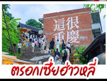
ตรอกซี้ยฮ่าวหลี่