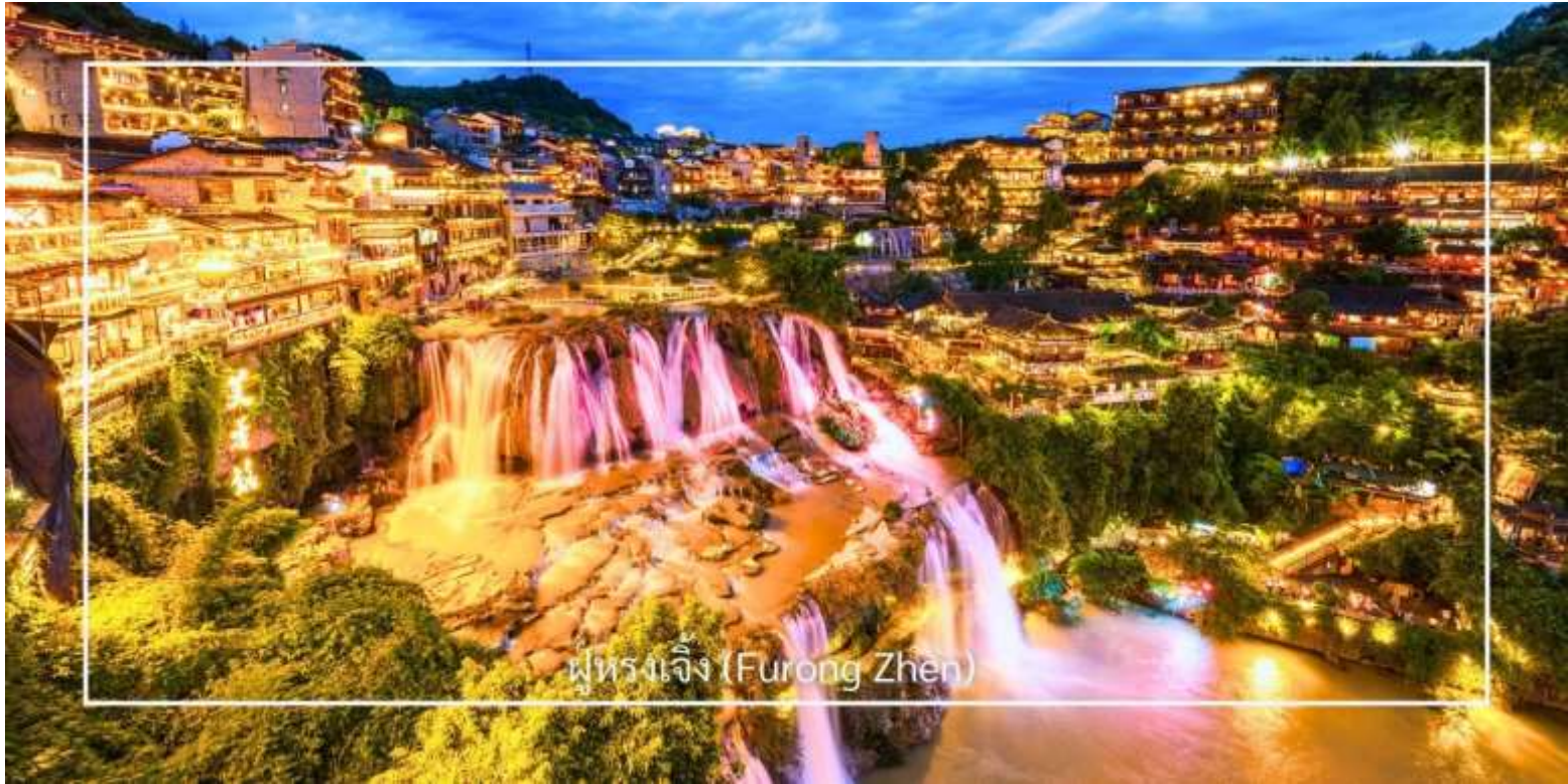
ฟูรงเจิ้ง (Furong Zhen)

ท่านสามารถเลือกซื้อบริการเสริม (Option) เพิ่มเติมได้: ถ้ามังกรเหลือง (รวมล่องเรือชมแสงสีในถ้ำ ราคา 350หยวน/ท่าน)