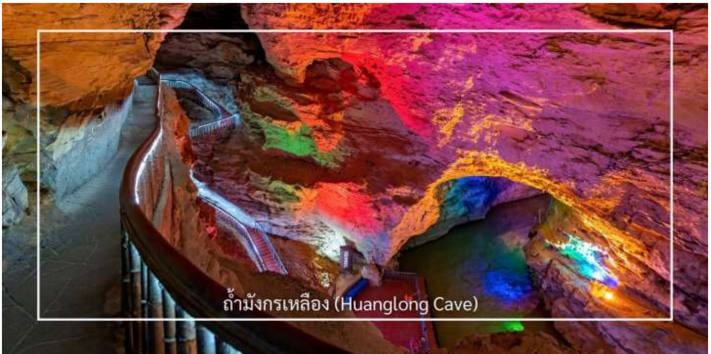
ถ้ามังกรเหลือง (Huanglong Cave)

ถ้ามังกรเหลือง หนึ่งในถ้ำหินงอกหินย้อยที่ยิ่งใหญ่และงดงามที่สุดของเมืองจางเจี๋ยเจี๋ย แหล่งท่องเที่ยวทางธรรมชาติที่ได้รับการยกย่องว่าเป็น “พระราชวังใต้พิภพ” แห่งดินแดนอู่หลิงหยวน ถ้ำแห่งนี้มีโครงสร้างขนาดใหญ่ แบ่งออกเป็น 4 ชั้น ภายในประกอบด้วยห้องโถงกว้างใหญ่ ลำธารใต้ดิน บึงธรรมชาติ และแนวระเบียงหินที่ทอดยาวอย่างน่าตื่นตา ความมหัศจรรย์ของหินงอกหินย้อยซึ่งก่อตัวสะสมมาเป็นเวลาหลายล้านปี ได้รับการจัดแสงอย่างสวยงาม ช่วยขับเน้นรูปร่างแปลกตาให้โดดเด่นราวงานศิลป์จากธรรมชาติ สัมผัสประสบการณ์ ล่องเรือชมแสงสีภายในถ้ำ โดยเรือจะนำท่านลัดเลาะไปตามสายน้ำใต้ถ้ำให้ท่านได้สัมผัสกับความยิ่งใหญ่ของธรรมชาติอันน่าอัศจรรย์ได้อย่างใกล้ชิด