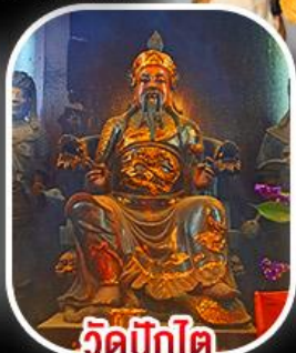
วัดบิกิต