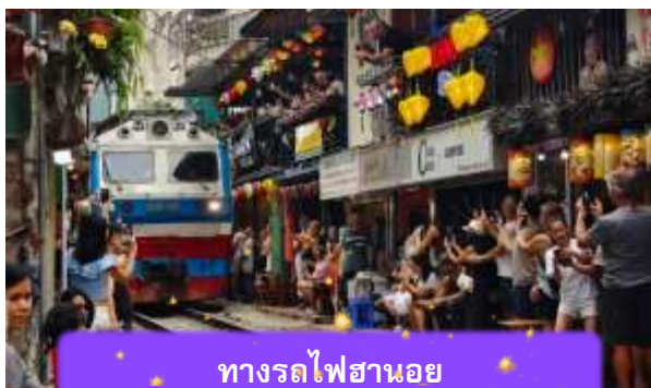
ทางรถไฟฮานอย

เช้า บริการอาหารเช้า ณ ห้องอาหารของโรงแรม หลังจากนั้นนำท่านเดินทางสู่ ทางรถไฟฮานอย เป็นแหล่งท่องเที่ยวที่ได้รับความนิยมในกรุงฮานอย ประเทศเวียดนาม. จุดเด่นของที่นี่คือทางรถไฟที่วิ่งผ่านย่านชุมชนที่อยู่อาศัย ทำให้เกิดภาพวิถีชีวิตที่แปลกตาและเป็นเอกลักษณ์ ท่านสามารถทดลองชิมกาแฟแท้ๆจากเวียดนามได้ที่นี้ อาทิ กาแฟนมเวียดนามที่มีความเข้มข้น กาแฟไข่นุ่มนวลหอมละมุน หรือกาแฟเกลือที่ทำให้ความรู้สึกแปลกแต่อร่อยอย่างบอกไม่ถูก (ไม่รวมค่าเครื่องดื่ม)