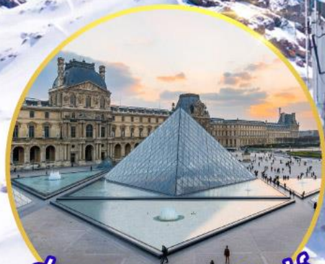
ถ่ายรูปคู่พีระมิดที่ลูฟร์