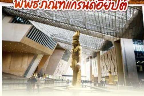
พิพิธภัณฑ์แกรนด์อียิปต์