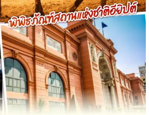
พิพิธภัณฑ์สถานแห่งชาติอียิปต์

ตามรอยอารยธรรมลุ่มแม่น้ำไนล์ ทั้งพีระมิด อเล็กซานเดรีย เมมฟิส ไคโร พิเศษ ทัศนียภาพเมือง พร้อมชมวิวพีระมิดอันยิ่งใหญ่ตระการตา