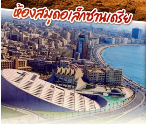
ห้องสมุดอเล็กซานเดรีย

ขยับแค 6 วัน 3 คืน มรดกอารยธรรมพีระมิด อียิปต์แดนฟาโรห์