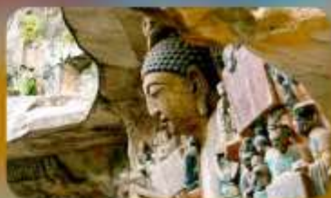
ฆาตินแกะสลักต้าจู้