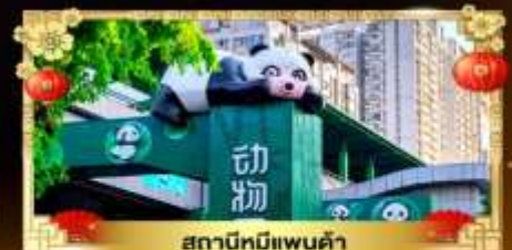
สถานีหมีแพนด้า