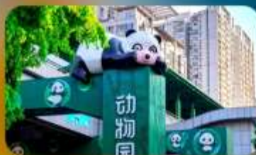
สถานีหมี่แพนด้า