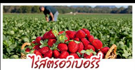
ไรศตรอบออร์รี่

คฤหาสน์เหวินเจิง - สวนซาถูระซิงเต่า ไรศตรอบออร์รี่ - โรงเบียร์ซิงเต่า