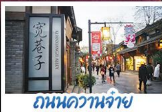
ถนนควานจ้าย