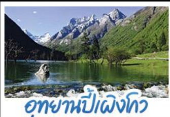
อุทยานปี้ฝิ่งโกว

ภูเขาสึ่ตงรุณี อุทยานจิวจ้ายโกว นั่งรถไฟความเร็วสูง น้ำพุไม่ใฝ่ตักSKP อุทยานปี้ฝิ่งโกว วัดต้าฉือ ถนนโบราณชอยกว้างชอยแคบ ช้อปปิ้งถนนไถ่กู่หลี่ + ถนนซุนชี่ลู่