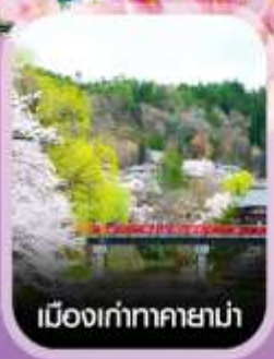
เมืองเก่าทาคายาม่า