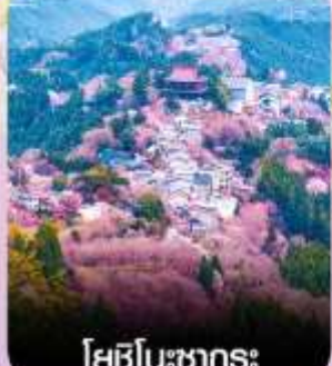
โยชิโนะชากุระ