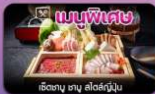
เมนูพิเศษ เซตทานุ ฮานู สโด้สกินุ

โอซาก้า-ชิราคาวาโกะ-ชมชากุระและดอกไม้บานาพันธุ์-เมืองเก่าทาคายาม่า-ซุปปังเจ้ากัเลิศ-ชินไซบาชิ-เที่ยวเต็มไม่มีอิสระ