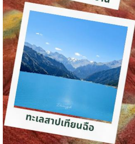
ทะเลสาปเทียนฉือ