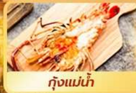
กุ้งแม่น้ำ