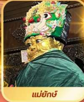
แม่ยักษ์