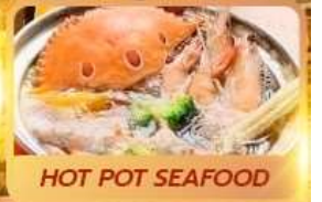
HOT POT SEAFOOD