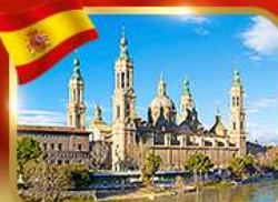
วิหารพระแม่มารีย์ ซาราโกซา