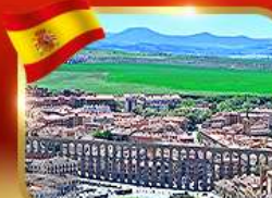
เที่ยวเมืองมรดกโลก เซโกเวีย