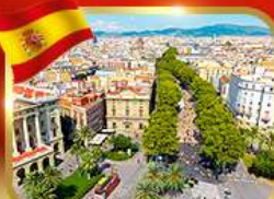
ลารัมบลาสตริก บาร์เซโลนา