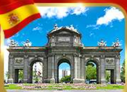
เข็ควินประตูอัลกาลา มาดริด